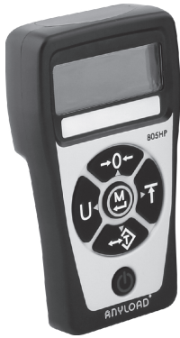
称重显示器键板图